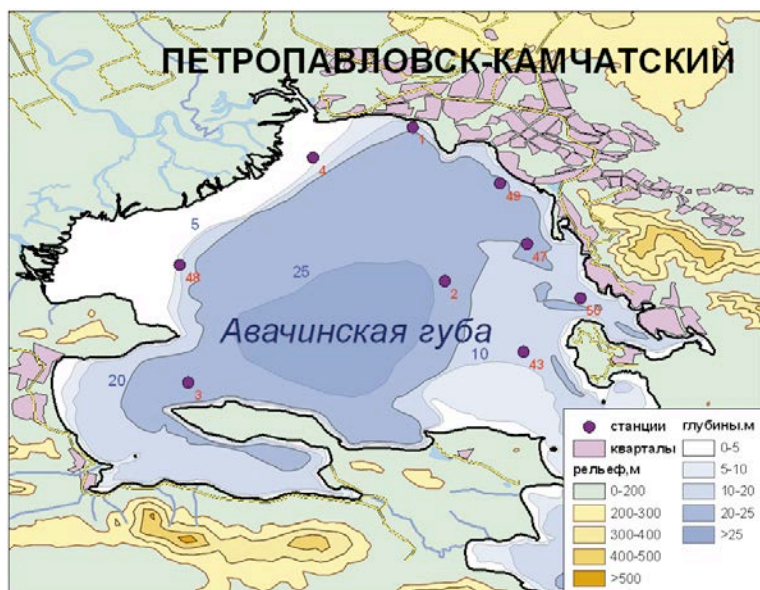
Рис. 10.1. Схема расположения станций мониторинга морских вод в Авачинской губе в 2010 г.

В 2010 г. Камчатским УГМС было проведено восемь гидрохимических съёмок (21.04, 25.05, 17.06, 22.07, 30.08, 23.09, 09.11, 20.12) на 9 станциях в Авачинской губе с борта арендованного судна (рис. 10.1). Анализ проб морской воды на содержание фенолов и детергентов выполнялся по методике «Руководства по методам химического анализа морских вод», Гидрометеиздат, 1977 г. Поскольку эта методика имеет более низкий порог определения (0,003 мг/л), то значения ниже предела обнаружения обозначены как «< 3 ПДК». Нефтяные углеводороды определялись методом ИК-спектрофотометрии на КН-2 по прилагаемой к прибору методике. Диапазон определения концентрации нефтепродуктов находится в пределах 0,02–2,00 мг/л.