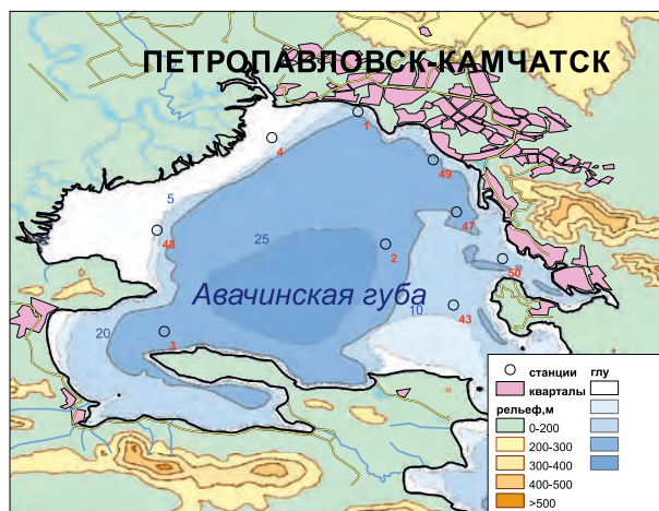
Рис. 9.1. Схема расположения станций мониторинга морских вод в Авачинской губе в 2012 г.

съемок ежемесячно с мая по октябрь на 9 станциях в Авачинской губе с борта арендуемого судна — катера «РУМ 45-63» (рис. 9.1). Нефтяные углеводороды определялись методом ИК-спектрофотометрии на КН-2 по прилагаемой к прибору методике. Диапазон определения концентрации нефтепродуктов находится в пределах 0,02–2,00 мг/дм 3 . После согласования с ФБГУ «ГОИН» внедрены в